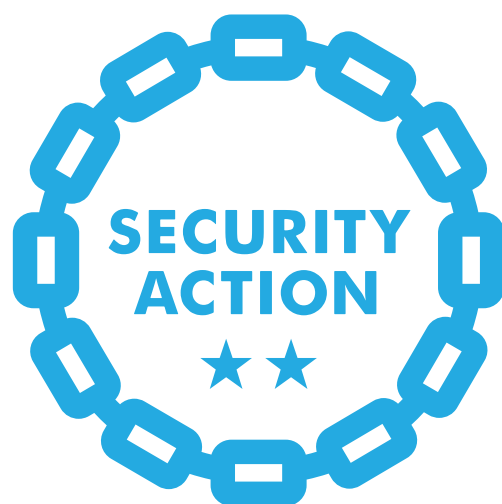
セキュリティ対策自己宣言

「SECURITY ACTION」は中小企業自らが、 情報セキュリティ対策に取り組むことを自己宣言する制度です。 自社の情報セキュリティを高め、強い組織を目指しましょう。