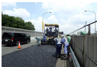
<傷んだ路面の補修>

工事概要 ▶ 舗装補修、防災設備設置などの工事やトンネル点検（設備を含む）などをおこなっています。