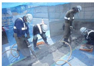
<橋のつなぎ目の取替え>