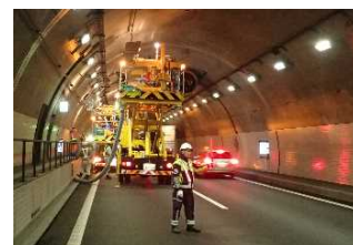
<トンネル内の点検>