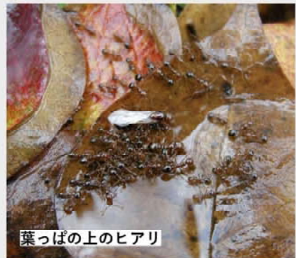
葉っぱ上のヒアリ