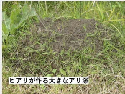
ヒアリが作る大きなアリ塚

これまで存在していなかった危険な毒アリが国内で現れています。 もし発見しても、 決して触らないでください！