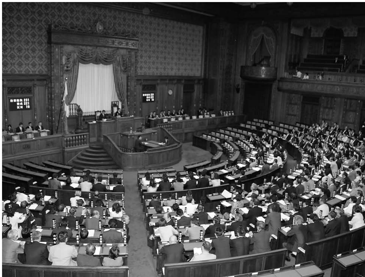
「運輸事業の振興の助成に関する法律」を賛成多数で可決した衆議院本会議 (8月11日・左)、参議院本会議 (8月24日・右)